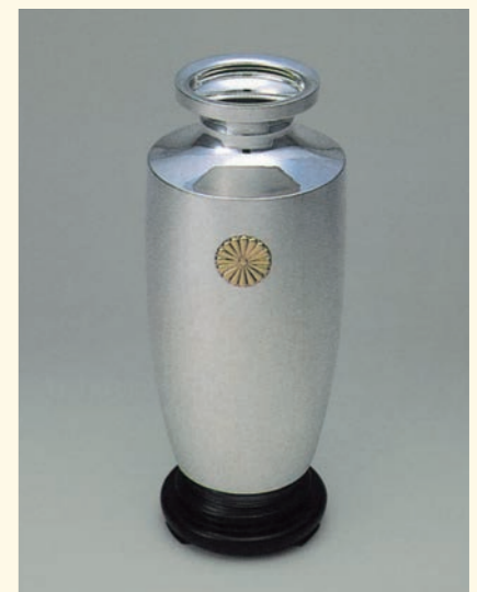
賜品「御紋付銀花瓶」(第34回まで)