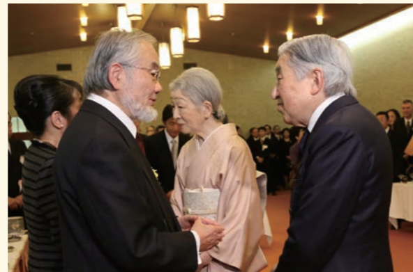
大隅良典博士(第31回受賞者)と天皇后陛下(当時) (記念茶会にて)