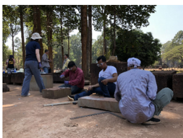
カンボジア王立芸術大学と実施した、アンコール遺跡の修復現場での石材加工実習。