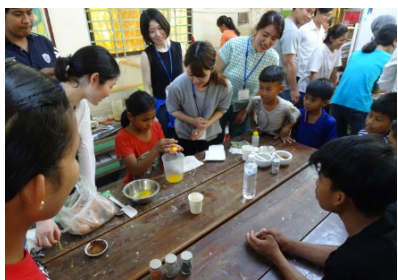
カンボジアで、子供達と一緒に現地の土を使った絵具作りのワークショップを開催。