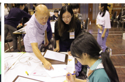
タイのシラパコーン大学では、産学連携によるアニメーション制作ワークショップを開催。