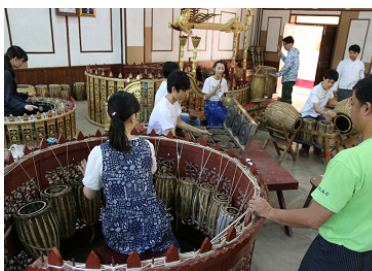
ミャンマー国立文化芸術大学では、伝統打楽器アンサンブル「サインワイン」を修得。