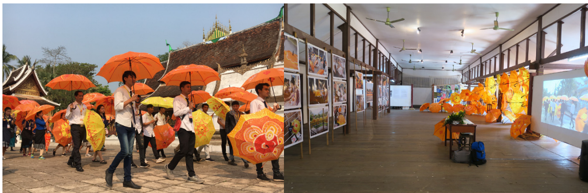
ラオス国立美術学校との共同による「アンブレラプロジェクト」。 ワークショップで制作した傘を差し、町の風景をいつもとはすこし違ったものに変えた。

本事業の中心的な取組である共同授業と協働社会実践では、本学と連携大学の双方の学生・教員がユニットチームを組み、派遣・招聘・双方向等の多様な交流形態により、相互の特徴的な芸術文化・技芸を学び合う交流授業や、都市・地域コミュニティ等を舞台とした展覧会、演奏会、ワークショップ、フィールドリサーチ、アートプロジェクト、シンポジウム等を実施した。