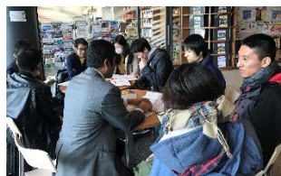
〈ラテン・アメリカンカフェ〉