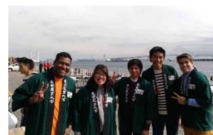
〈株式会社メルカード東京農大でインターンシップ〉