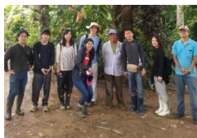
〈ブラジル派遣学生6名と引率者がパラ州にあるトメアス農協を見学〉

本年度は、事業コーディネーター採択、プログラム構築、受入大学等との連絡調整、学生募集とプログラム実施、成果報告会開催を短期間で実施したにもかかわらず、完遂することができた。本事業が目指す中南米で活躍できる人材を育成する派遣・受入プログラムとして組み込んだ5大要素(①専門科目受講、②現地語研修、③現地学生との交流、④農学系インターンシップ、⑤農業・農学関連施設見学)を盛り込むことができた。特に、④農学系インターンシップ実施は、派遣プログラムでは海外支部校友会及び関係者の調整と受入先引受(ブラジル・トメアス農協、ペルー・カムカム協会、メキシコ鈴木農場)において、受入プログラムでは大学発学生ベンチャー企業(株)メルカード東京農大、地域連携協定締結自治体の長野県長和町において、実学的な取組目標を達成した。