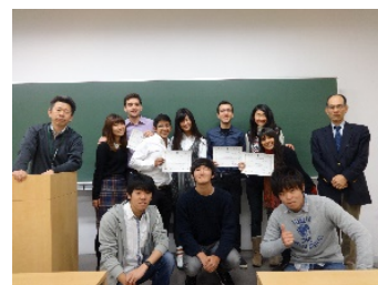
〈受入学生4名の修了証書授与式〉

世界展開力事業は、本学の強みを活かした中南米における人材育成事業であり、継続事業として公募要領のとおり、毎年度10%減額した予算額で申請し採択された。しかし、採択後にこの申請額に対して20%削減していくとの連絡を受けた。適正な申請額に対して毎年1/5の補助金額の削減では本事業を申請計画通り実施することが年を重ねる毎に困難になることをご理解いただきたい。本プログラムは非常に有益なものであり、海外協定校から短期受け入れプログラムに参加した学生4名のうち2名は、日本の大学院・学部への進学を希望している。本事業のH27短期派遣プログラムに参加した本学参加学生の3名が長期派遣プログラム(半年・1年)に参加をする予定であり、短期と長期とを組み合わせたプログラムの相乗効果が早くも現れている。また多数の学生がスペイン語・ポルトガル語を継続的に学びたい等、参加学生に将来の方向性を与えるプログラムとなっている。