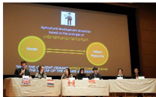
〈世界学生サミット〉

協定校: サンパウロ大学(ブラジル)、アマゾン農業大学(ブラジル)、ラ・モリーナ国立農業大学(ペルー)、チャピango自治大学(メキシコ)