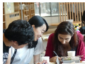
〈ラテンアメリカンカフェ〉

本事業が幅広く協定校でも知られるようになり、平成30年度は昨年度と比較し交流人数が増加した。中南米と日本の架け橋を担う、また中南米地域における食・農・環境分野の実践的な専門家の育成の取り組みとして、以下の4つのプログラムを継続的に実施した。