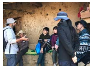
〈短期派遣プログラム(ペルー)〉

最終年度となった令和元年度は、中南米と日本の架け橋を担う、また中南米地域における食・農・環境分野の実践的な専門家の育成の取り組みとして、以下の4つのプログラムを継続的に実施したことに加え、本事業終了後の交流について各協定校と協議を行った。また、年度末には5年間の総括として学生アンケートを実施し、成果報告会を開催した。