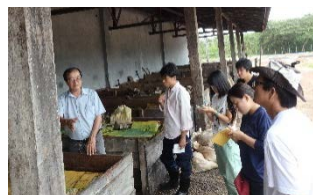
〈トメアス総合農業協同組合でインターンシップ、ブラジル〉