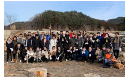
〈 H31.2 スプリングプログラム@岩手 〉