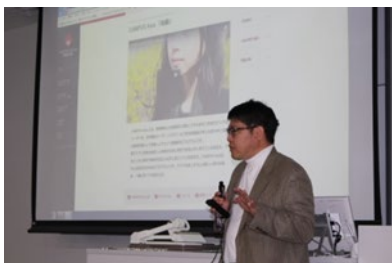
〈2017.4.3 キャンパス・アジア 新生向け説明会〉

各大学の参加学生間での交流について協議を進め、その成果として4月19日に高麗大学校のキャンパス・アジア参加学生を日本に招き、早稲田大学のキャンパス・アジア参加学生との交流を実現した。