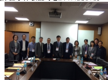
〈2017.9.20 第5回 ICPCミーティング@高麗大学校〉