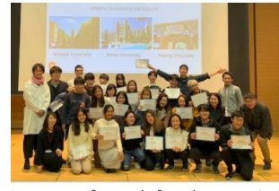
〈R2.2 スプリングプログラム@本学〉