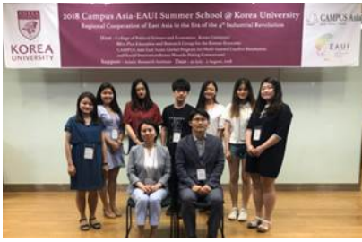
〈 H30.7 サマープログラム@高麗大学校 〉