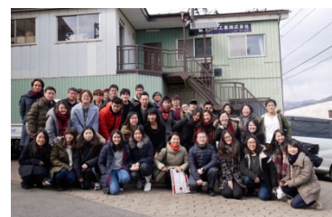
〈2018.2.9 ウィンタースクール企業訪問@岩手・釜石〉