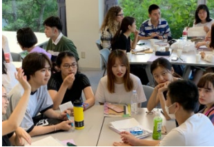
〈R1.8 サマープログラム@本学〉