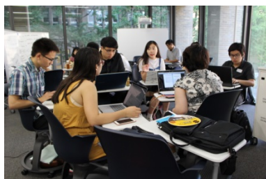
〈2017.8.9 サマースクール グループワーク@本学〉