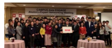
〈R2.2 高麗大校舎・本学共催 アラムナイ&エキスパート ネットワーキングミーティング@本学〉