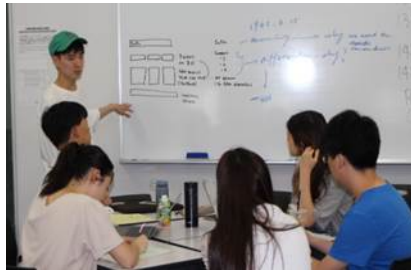
〈 H30.8 サマープログラム@本学 〉