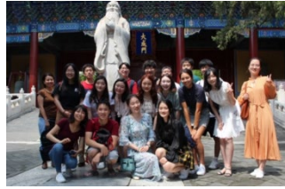
〈R1.8 北京学生フォーラム@北京大学〉