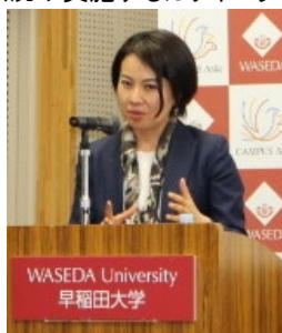
〈2018.5.15 第7回 Waseda Meets Global Leaders〉