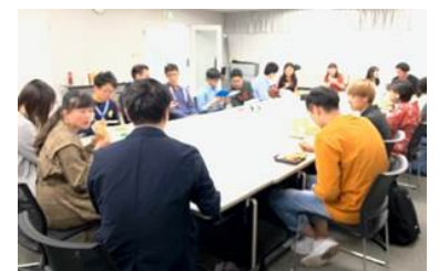
〈 H31.4 キャンパス・アジア学生ランチ@本学 〉