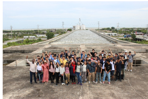
〈2. 双方向短期留学プログラムの様子〉