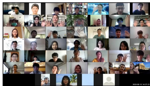
(2. 双方向短期留学プログラムの様子)

また、5つの教育プログラム推進のために必要となる事業推進会議をオンラインにて開催した。さらに、プログラム終了後における継続的發展をめざしたファカルティディベロップメントシンポジウムをオンラインで開催した。