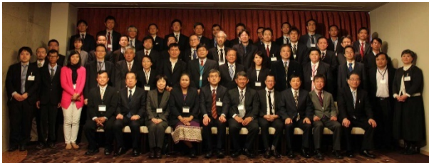
〈オープニングFDシンポジウムの参加者〉

を行った。29年3月には、参画大学が一堂に会してオープニングFDシンポジウムを実施し、これまでの交流実績を踏まえて本事業で実施する交流プログラムの具体的内容について議論し、5つのプログラムの実施内容について合意した。