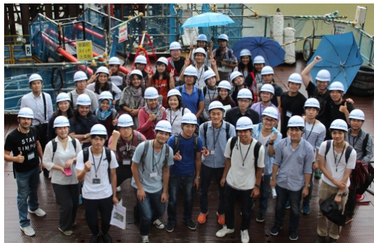
〈2. 双方向短期留学プログラムの様子〉