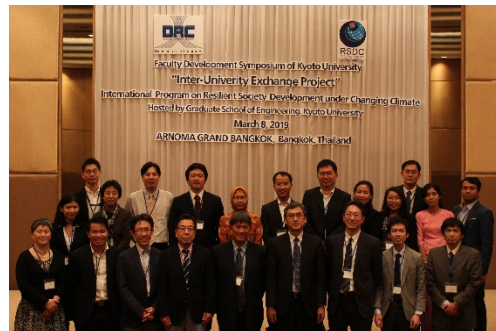
〈ファカルティディベロップメントシンポジウムの参加者〉

学生の相互交流を実施した後に、実施したプログラムの内容を吟味して翌年に向けて改善するため、質を確保するために必要な要件、参画大学の貢献について、ファカルティディベロップメント活動を通じて確認した。特に、平成31年3月にはバンコクにてファカルティディベロップメントシンポジウムを開催し、連携大学メンバーが集まり、提供する科目の質を確保して単位の実質化を図ることに合意した。