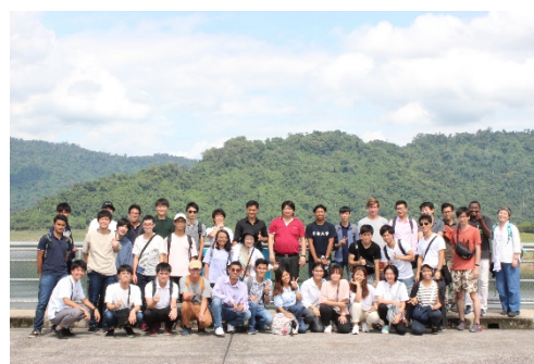
〈2. 双方向短期留学プログラムの様子〉