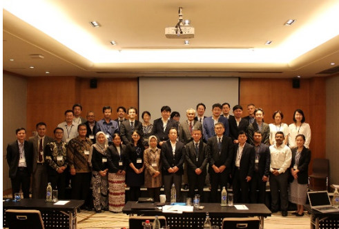
〈ファカルティディベロップメントシンポジウムの参加者〉