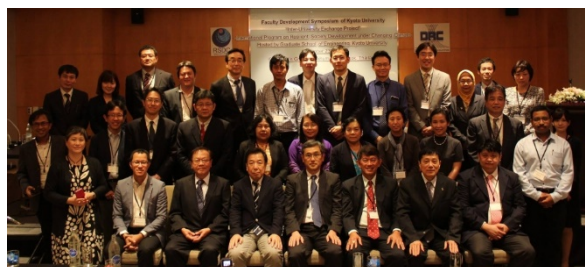
〈ファカルティディベロプメントシンポジウムの参加者〉

学生の相互交流を実施した後に、実施したプログラムの内容を吟味して翌年に向けて改善するため、質を確保するために必要な要件、参画大学の貢献について、ファカルティディベロプメント活動を通じて確認した。特に、平成29年11月にはバンコクにてファカルティディベロプメントシンポジウムを開催し、連携大学メンバーが集まって、提供する科目の質を確保して単位の実質化を図ることに合意した。