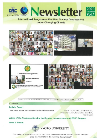
< Newsletter Vol.7 >

事業の枠組を紹介するホームページ http://www.drc.t.kyoto-u.ac.jp/rsdc/ と、イベントを速報的に紹介するFacebookページ https://www.facebook.com/DRC-Kyoto-University-233253546869886/ と連動させて大学の国際化に資する情報の公開、成果の普及を実施した。また、ニューズレターVol.7,8を発行した。